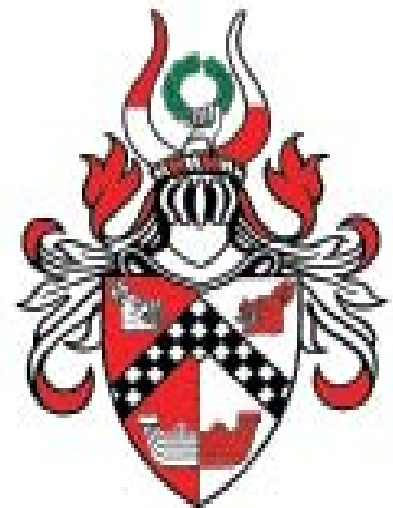
Finn Stavnsbo Exlibriset tecknat av Jesper Wasling och tryckt 2006. Vapnet antogs 2006.