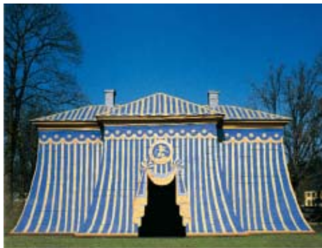
Haga slott med sina tält i koppar uppfördes av Gustav III.