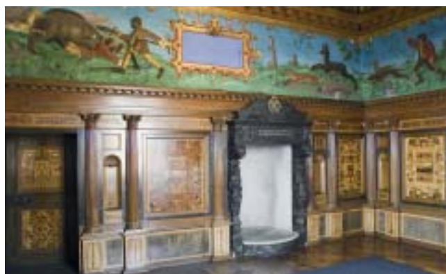
OVAN. Kalmar slott renoverades av hertig Erik innan han ärvde tronen under namnet Erik XIV. Ett slott i välbevarad vasarenässans.